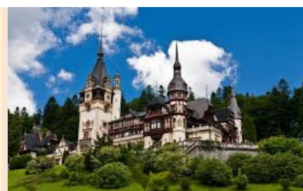
Sinaja – Dvorac Peleš