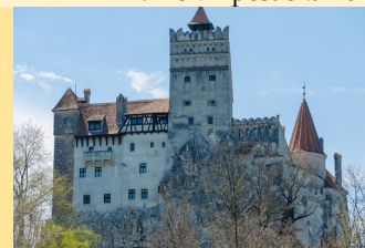
XIII v, enterijer i eksterijer