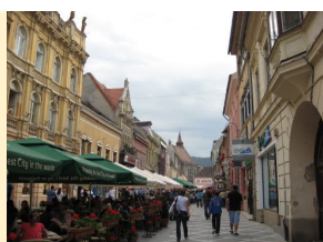
Brašov, gotska katedrala Biserica Negra, XV vek i pešačka zona