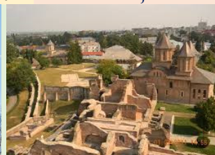
Trgoviste – Vladarski dvor