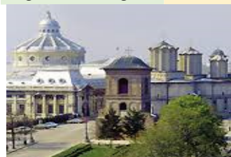
Bukurešt – istorijski centar