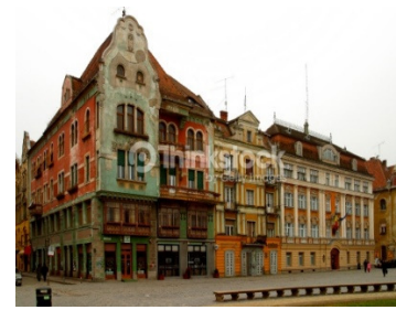
Temišvar – detalj iz centra

živeo čuveni ugarski regent Hunjadi Janoš u našim epskim narodnim pesmama opevan kao Sibirjanin Janko. Obilazak ovog zdanja kao kruni celog našeg putovanja. Nastavak vožnje do Temišvara, našeg konačnog odredišta obilazak znamenitosti: Trg Ujedinjenja, Bastion Marije Terezije, Srpska Saborna crkva, Trg Pobede, Dvorac Hunjadi Janoša, Gradska opera, replike kipa rimske vučice koja doji Romula i Rema, Trg Slobode sa starom gradskom kućom... Slobodno vreme. Posle usputnih pauza po programu organizatora putovanja, dolazak u Beograd na mesto polaska u kasnim vernjim satima. Transfer do Jagodine. Završetak programa